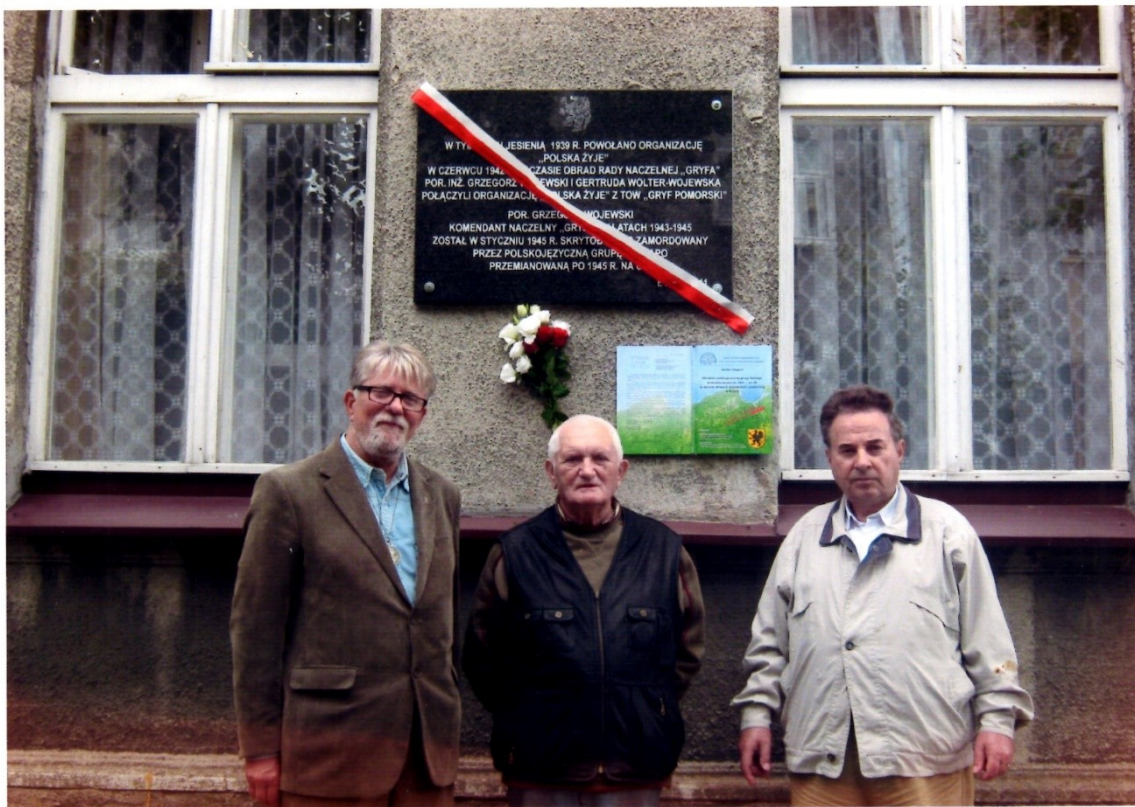
Tablica umieszczona jest w Wejherowie na kamienicy przy ulicy 3 Maja nr.4 Kamienica należała do rodziny Wolterów, bardzo zasłużonej dla utrzymania polskości Pomorza. Obecny jej właścicielem jest Pan